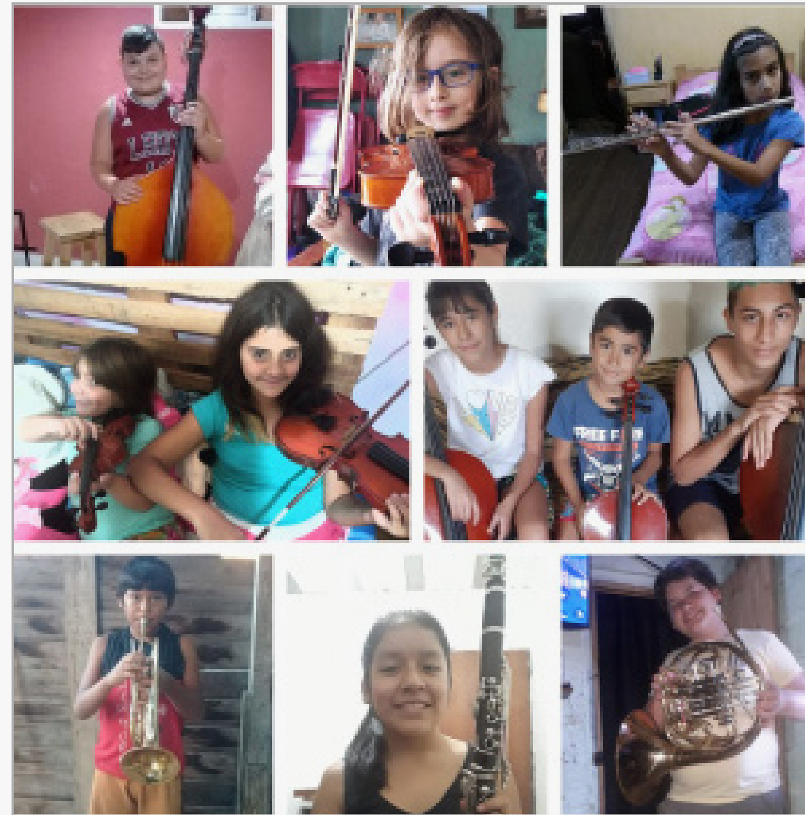
niños aprendiendo desde casa con la Orquesta Escuela de Berisso