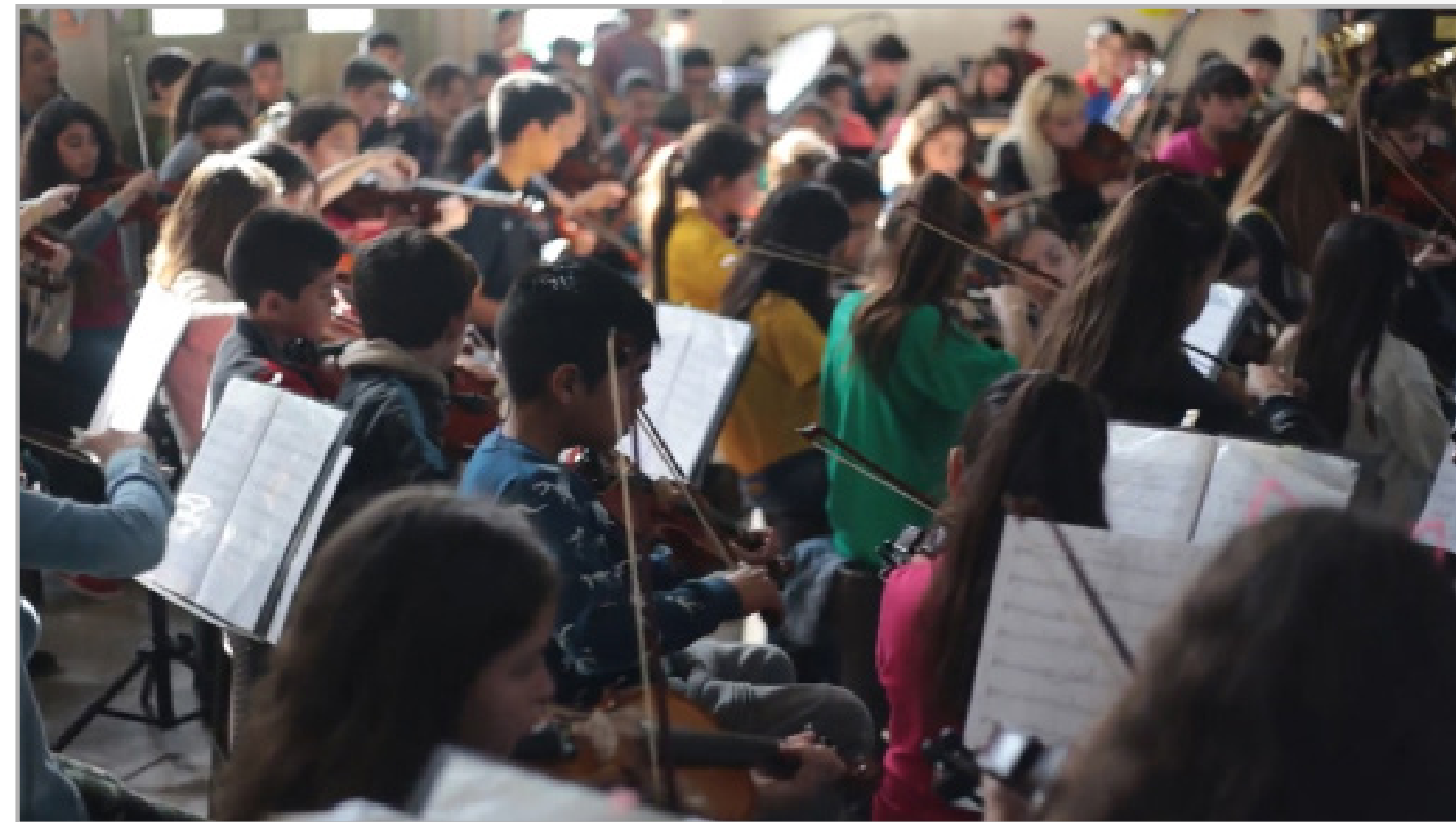
Orquesta Escuela de Berisso (pre pandemia)